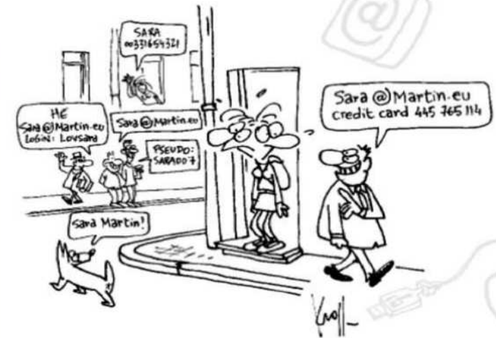
Illustration © Pierre Kroll © Union européenne, 2012

Direction scientifique : Céline Castets-Renard, Professeur